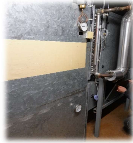
Kuva 4. 5. ja 6. Ilmastointilaitteet, turvakytkin ja laitteiden ohjaus lämmönjakokeskuksessa