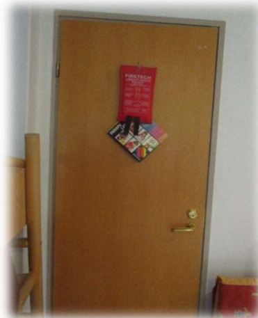
Kuva 9. Kerhuhuoneessa jauhesammutin ja sammutinpeite