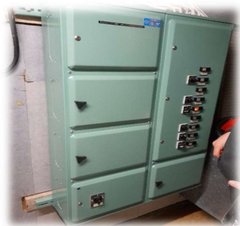
Kuva 7. Sulakekaappi