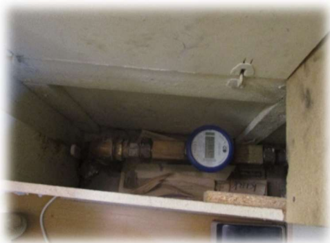
Kuva 8. Käyttöveden pääsulku viraston pukuhuoneessa