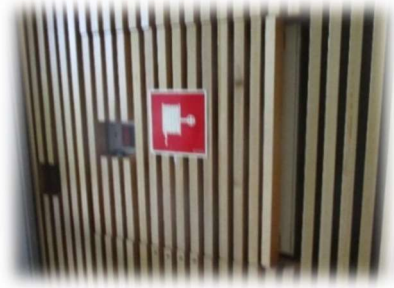
Kuva 10. Paloletku srk-keskuksen tuulikaapissa.