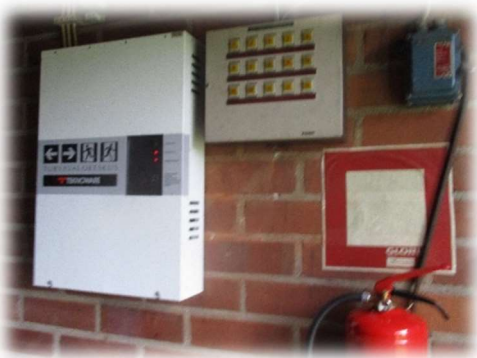
Kuva 3. Turvavalokeskus lämmönjakuhuoneessa