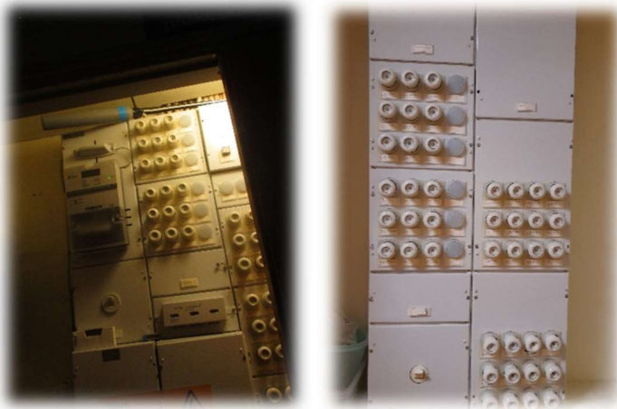
Kuva 1 ja 2. Sähköpääkeskus srk-salin aulassa ja salin viereisessä 'pakastehuoneessa' oman oven takana

Srk-salista ovi lähivarastoon, josta raput ylös