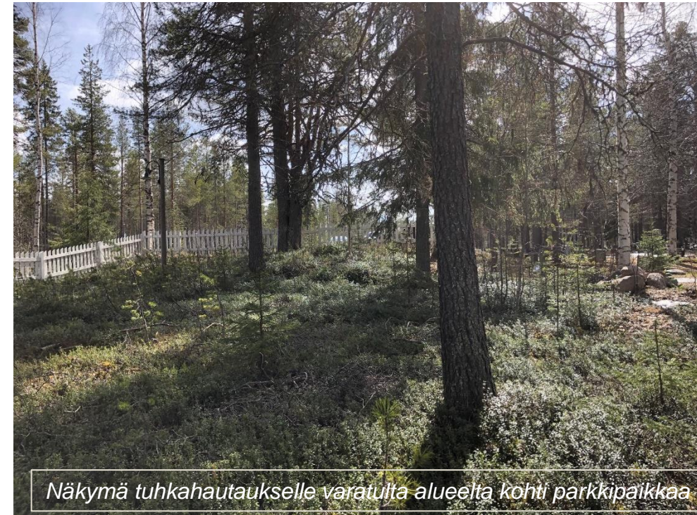
Näkymä tuhkahautaukselle varatulta alueelta kohti parkkipaikkaa

Tulevalle uurnahautausmaalle ei nykyisellään ole suoraa kulkuyhteyttä tai porttia. Varsinaiselle hautausmaalle on olemassa portti ja sieltä kautta pääsee kiertoteitse tulevalle uurnahautausmaalle.