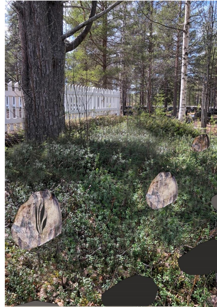
Havainnekuva 1. Uurnahautausmaa

Uurnahautojen hautakivet ovat pienempiä, kuin normaalit arkkuhautojen muistokivet. Metsämaisemaan sopisi hienosti esim. luonnonkivet.