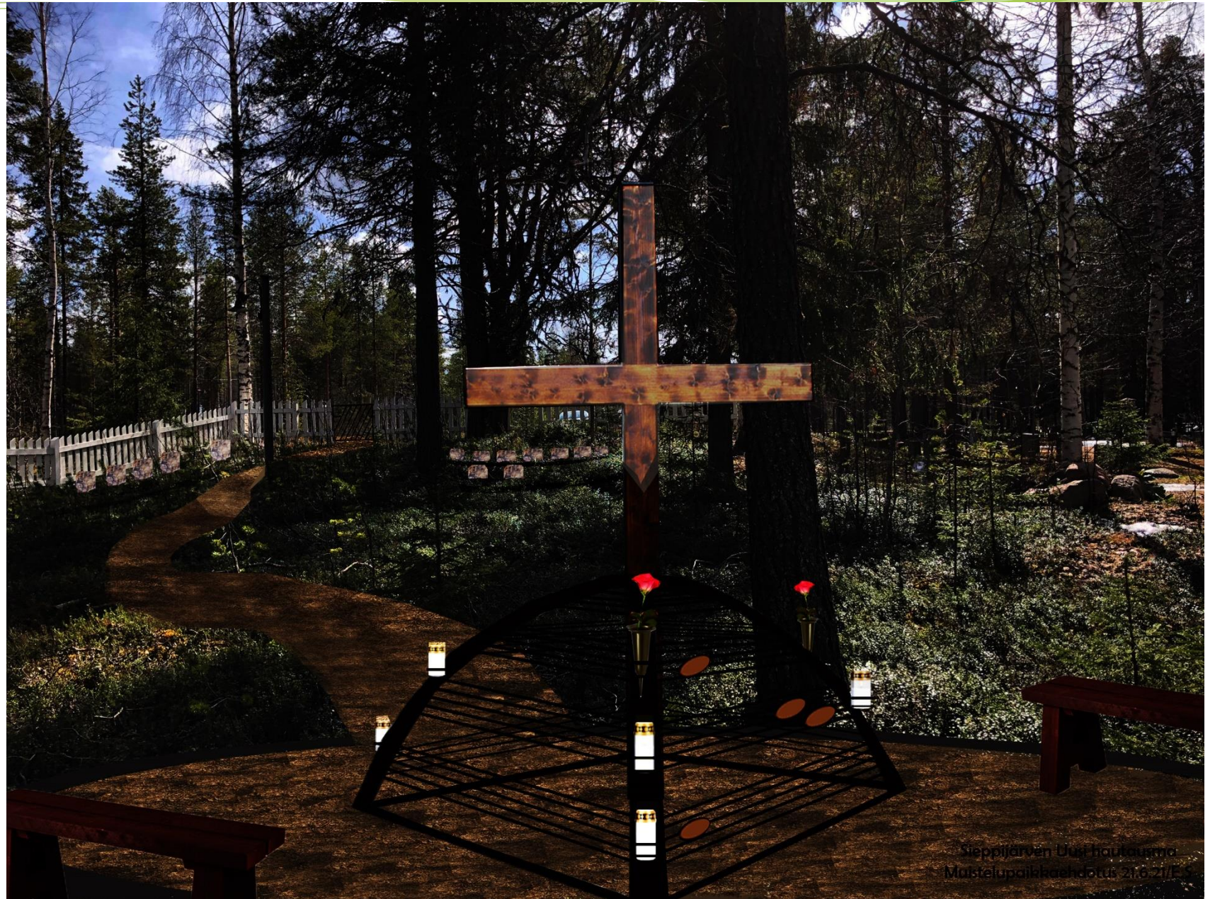
Seppijärven Uusi hautausma, Muistelupaikkaehdotus 21.6.21/E

Muistelupaikka voitaisiin valaista kohdevaloilla, jotka suunnataan kohti puuristin yläosaa, jotta valaistus ei pilaisi kynttilöiden luomaa tunnelmallista valoa.