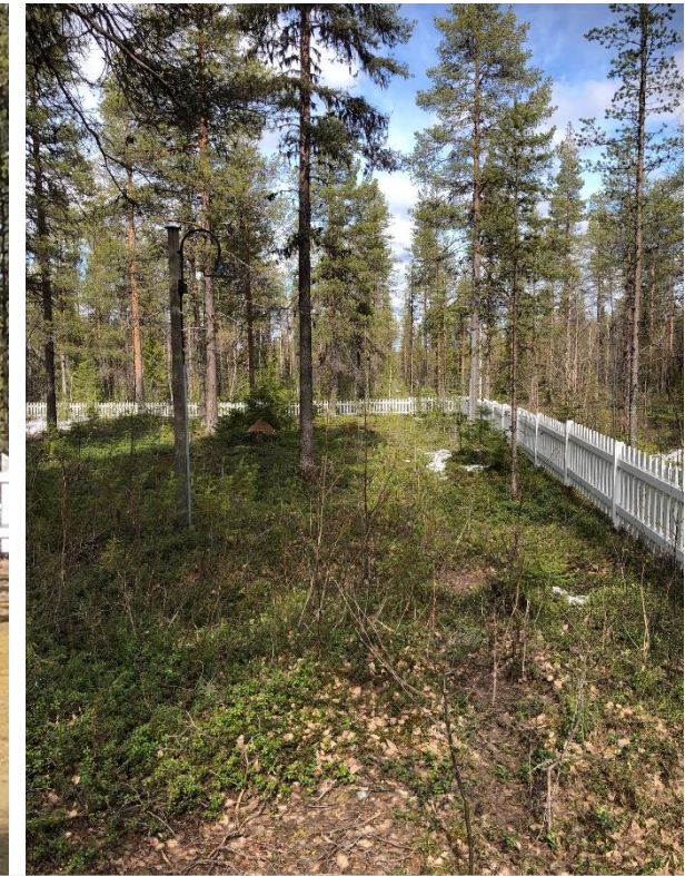
Hautausmaata ympäröivä puuaita. Näkymä parkkipaikalta kohti tulevaa tuhkahautausaluetta.