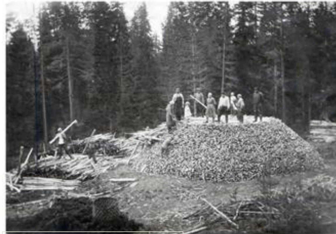
Tervan polttoa ennen vanhaan.