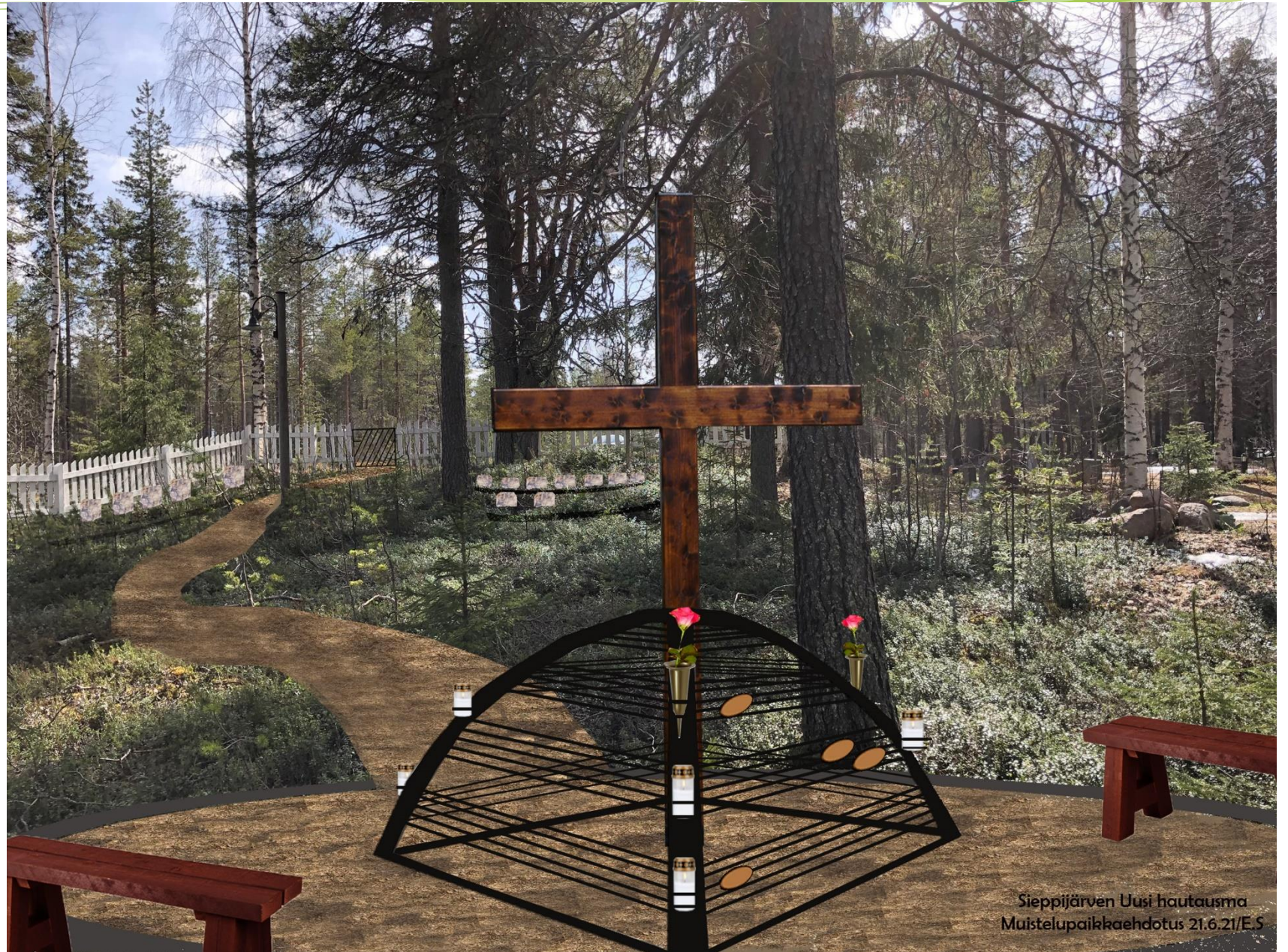
Sieppijärven Uusi hautausma Muistelupaikkaehdotus 21.6.21/E.S

Tarkoitus on, että muistelupaikka palvelisi samalla myös muualle haudattujen muistomerkkinä.